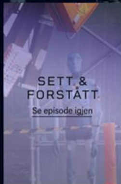
EPISODE 1 Fallende gjenstander