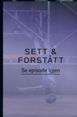
EPISODE 2 Fall fra høyde